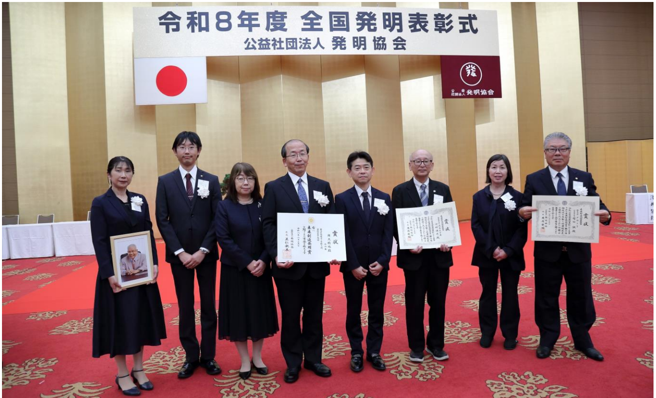
【受賞者および関係者による記念撮影】