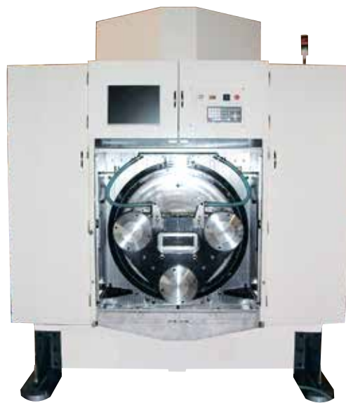
Wire Path Line