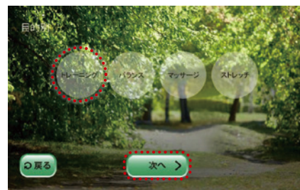
③ 「トレーニング」→「次へ」を押す