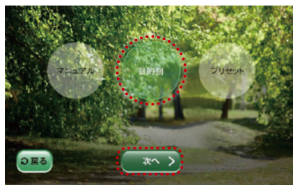
② 「目的別」→「次へ」を押す